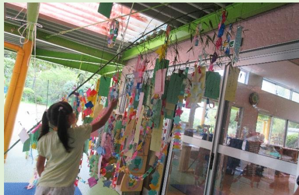
神尾保育園での七夕飾り。願いが叶いますように。

○6月26日(月)～30日(金)の期間を「七夕笹頒布会」として、エコアくまもとの敷地内に自生している笹を希望者へお配りしました。