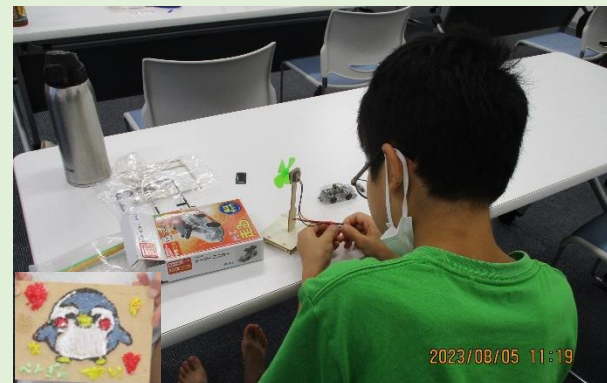
夏休みの思い出になったかな？

○8月5日(土)に、「夏休みの工作デー」を開催。ソーラーミニカーや風力発電キット、リ・グラスアートの製作を行いました。