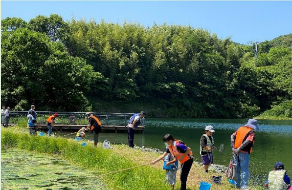
皆さん、スジエビ釣りに夢中です！

○6月3日(土)に、今年1回目の「スジエビ釣り大会」を開催。天候にも恵まれ、たくさんのスジエビをとることができ、参加者の皆さんにも大変喜んでいただきました。