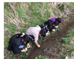
放流会の様子(令和5年3月)

エコアくまもとと鹿島環境エンジニアリング(株)は、南関第二小学校のホタル飼育・放流の取組みを支援しています。