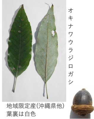
オキナワウラジログアシ