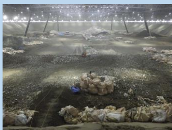
「エコアくまもと」 覆蓋施設埋立状況(令和3年9月30日)

品目別では、多い順に「がれき類」が9,942トン、「ガラスくず・コンクリートくず・陶磁器くず」が6,501トン、「汚泥(無機性)」が2,692トンとなっています。