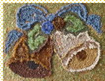
リ・グラスアート作品