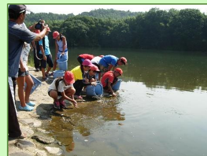
菊池川稚魚放流事業(平成28年8月)

8月には、菊池川漁業協同組合と共催で、稚魚放流事業を実施しましたが、菊水西小学校の13名の児童にも参加してもらい、初めてウナギを触る子供たちからは歓声が沸き上がりました。