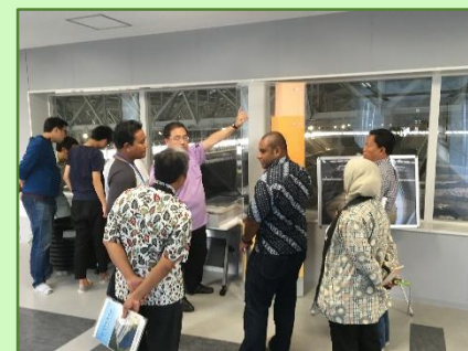
インドネシア研修員の見学(平成28年10月)

施設見学についても、県内外の行政団体や大学、企業等から数多くお越しいただき、多重の遮水構造をはじめ、当施設の高い安全性に興味を示されました。