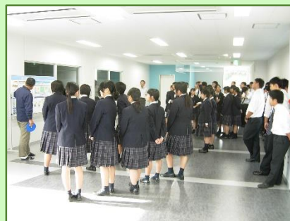
岱志高校による見学(平成28年10月)