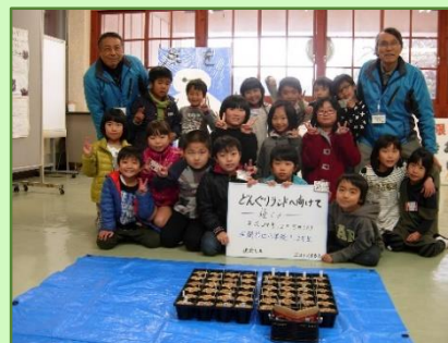
南関第四小でのどんぐりの種まき(平成28年12月)

平成28年度は1月末までに、のべ2,001名の皆様にエコアくまもとにお越しいただきました。