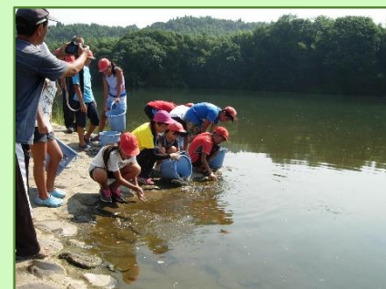
菊池川稚魚放流事業(平成28年8月)

8月には、菊池川漁業協同組合と共催で、稚魚放流事業を実施しましたが、菊水西小学校の13名の児童にも参加してもらい、初めてウナギを触る子供たちからは歓声が沸き上がりました。