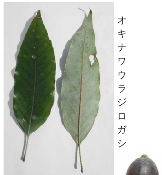
オキナワウラジログアシ