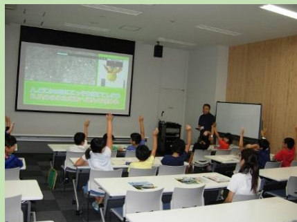
南関第三小学校による見学（平成28年6月）

そのほか、県立教育センターによる研修の一環として、荒尾・玉名・山鹿地区の小中学校の先生方に施設を見学していただきました。