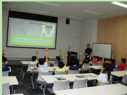
南関第三小学校による見学（平成28年6月）

地元南関町からは、3月に南関高校、6月に南関第三小学校、7月に南関中学校から見学にお越しいただきました。