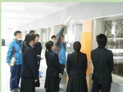
南関高校による見学（平成28年3月）

また、中学生や高校生からは、こちらが唸るような質問も飛び出し、環境問題への意識の高さに感心させられました。