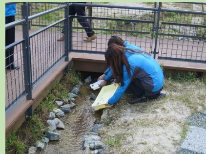
ホテルの幼虫放流（平成28年3月）