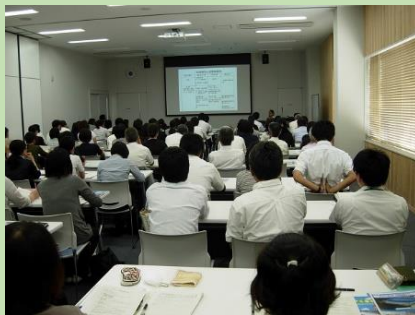
小中学校の先生方への研修（平成28年6月）

自然環境エリアでは、ホテル池でホテルの幼虫の放流を行い、5月には、夜にホテルが飛び交う様子を目にすることができました。